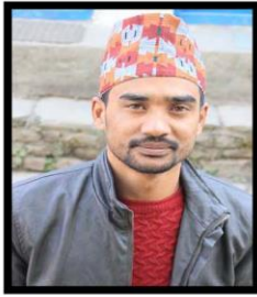
कल्याण श्रेष्ठ सदस्य